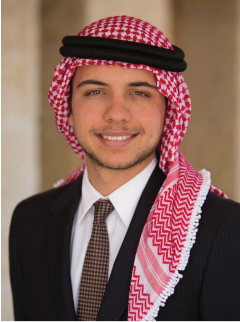
صاحب السمو الملكي الأمير حسين بن عبدالله الثاني بن